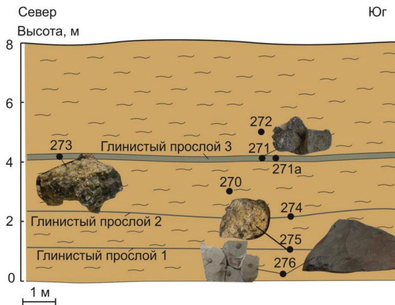
Рис. 1. Схема опробования палеопелоидов и продуктов их преобразования в карьере Лесная Ферма.

В верхней части стенки карьера разрывные нарушения отсутствуют. Неизменный аргиллит из этой части разреза (обр. 272) содержит до 1 мас. % серы, в породе из наиболее мощного прослоя глины (обр. 271) содержание сульфидной серы (S) составляет 21.88 мас. %, сульфатной серы (SO 3 ) – 3.6 мас. %. Возможно, часть серы в глинистых прослоях присутствует в самородном виде. Определение состава тонкой фракции пород с использованием растрового электронного микроскопа (РЭМ) Quanta–200 (подготовка и съемка К.Ю. Арсентьева, ЛИН СО РАН) показало высокое содержание в породах тонкодисперсных сульфидов и сульфатов.